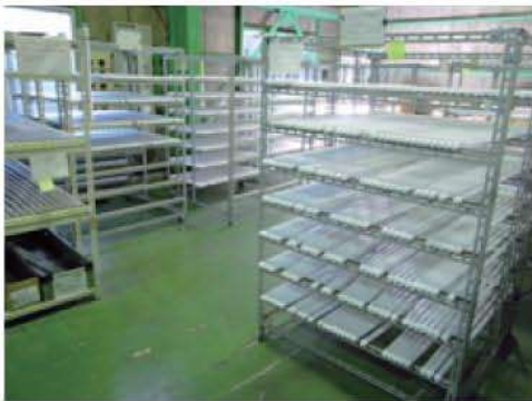
エージング中のLEDランプ

製品は、全数エージングを実施、初期不良を未然に防ぐとともに品質管理を徹底しています。