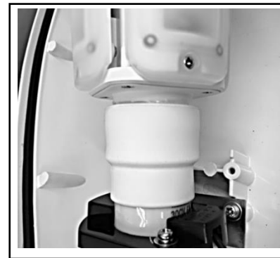
ランプを器具に取り付ける