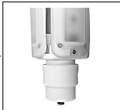
ランプにパッキンを取り付ける