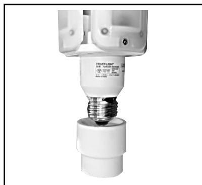
ランプとパッキンを準備する