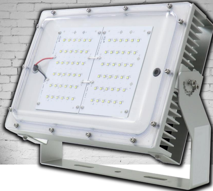
地上取付例 (クリアカバーモデル)