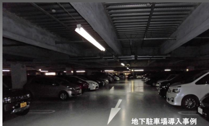
地下駐車場導入事例